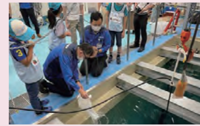
大型水槽での実験の様子