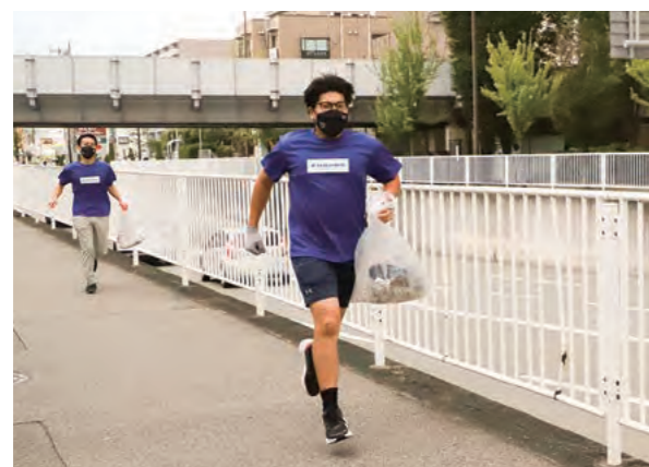
右手にはトング、左手にはゴミ袋。夢は西宮市をプロギングの街に？！