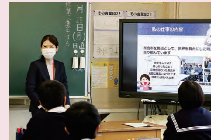
芦屋市立精道中学校での出前授業の様子

を選んだきっかけや現在の仕事内容、やりがいなどを伝えることで理系の職業への興味・関心を高め、将来の自身のキャリアプランを考えるきっかけになることを目的に取り組んでいます。