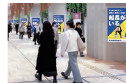
「ゲート館縦型サイネージ」放送イメージ