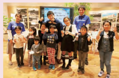
海や魚、環境問題について、FURUNOだからこそ伝えられるメッセージを届けていく

「西宮の海を未来へつなごう!～西宮の海って、どんな海～」をテーマに、身近なおさかなに関するクイズやワークショップなどを通して子供たちに海の魅力と楽しさを伝え、海を大切にする想いにつなげています。