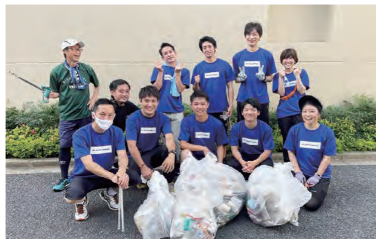
プロギングで心も身体も健康に！

エコに、そして地域の方や社員間での新たな交流の場にも！笑顔で環境問題を解決に導く、新感覚のSDGsスポーツに取り組んでいます。