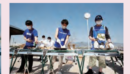
海鮮パエリアのふるまい