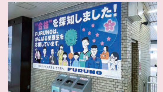
阪急西宮北口駅構内の応援ポスター

FURUNOのことを知っていただき、当社をもっと身近に感じてもらうため、企業CMを実施しています。受験シーズンには、本社最寄りの阪急西宮北口駅構内において「合格”を探知しました!FURUNOは、がんばる受験生を応援しています。」など、受験生に向けたオリジナル応援メッセージを掲出しています。