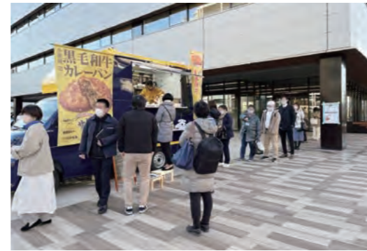
新研究開発棟 SOUTH WING前のキッチンカー

2021年12月から運用を開始した新研究開発棟SOUTH WING前において、朝カフェ企画を実施しています。本企画では「社員がFURUNOを好きになる、地域の方がFURUNOに親しみをもつ」をコンセプトに、西宮近隣にある飲食店舗が運営するキッチンカーを出店いただいています。人が自然に集まり、つながる場を提供しています。