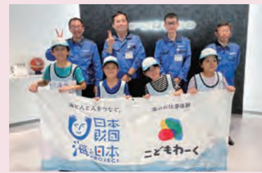
イベントに参加した子供たちと講師担当の当社社員

に関わる仕事を子供たちに体験してもらうことでより学びを深めます。夏休みには、魚群探知機や実際の実験でも使用する大型水槽などを用いて「見えないものを見る”技術で海のゴミ問題にチャレンジ”を開催しました。