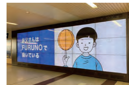
最寄り駅の阪急西宮北口駅構内で放映