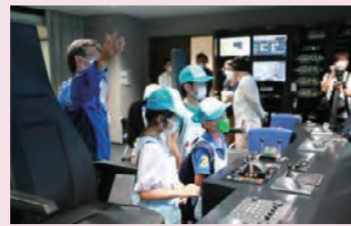
商船シミュレーターの操船体験の様子