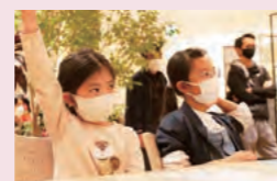
カラフルな絵の具で、魚のイラストに色とりどりの模様を描く