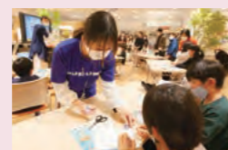
FURUNOのお姉さんも優しく目をきらきらさせながらクイズに参加する子供たち