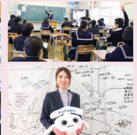
質問の数々に時間を忘れるほど!積極的な生徒たちに思わずにっこり