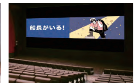
「TOHOシネマズ西宮OS」放送イメージ